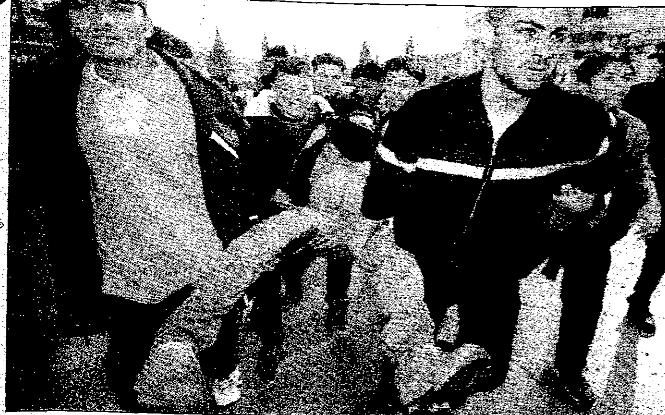
شباب فلسطينيون يحملون زيملاهم اصيب في الاشتباكات مع القوات الاسرائيلية

كانتينا - رويترز - حذر وزير الدفاع الاسترالي ايان مكلاخلان الاستراليين من تجاهل ابعاد الضربة العسكرية المحتملة في الخليج قائلا ان الاستراليين لا يدركون في الغالب القدرات العسكرية للرئيس العراقي صدام حسين. وكان وزير الدفاع الاسترالي يعلق بذلك على استطلاع للرأي اجري في الازمة قال فيه عدد كبير من الاستراليين انه لا توجد حاجة لتورط استراليا في اي تصد عسكري تقوم به الولايات المتحدة ضد صدام. وقال مكلاخلان لهيئة الاذاعة الاسترالية -«انا كان ذلك رأي عينة من الاستراليين فمن لهم ان يعرفوا انهم اذا هجموا حقا ماذا يضرهم صدام». اعني انه يملك فعلا مواد حربية كيميائية وبيولوجية بالاضافة الى صواريخ ونعتقد ان بوسعه انتاج اسلحة كيميائية وبيولوجية خلال اسابيع. واتصل الرئيس الامريكى بيل كلينتون جون هاورارد يوم السبت مستفسرا عن استعداد استراليا للمشاركة في اي عمل عسكري محتمل ضد العراق. وقال وزير الدفاع الاسترالي ان حكومته ستناقش هذه المسألة اليوم الثلاثاء، وشركتها استراليا بقراراتها وسعيدة بمعاونة في حرب الخليج عام 1991 لكنها لم تشارك في قوات في القتال.